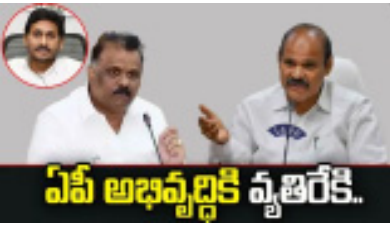
ఏపీ అభివృద్ధికి వ్యతిరేకి.

సంస్థ కార్యాలయంలోని సమావేశపు మందిరంలో 11వ తేదీన ఉదయం 11 గంటలకు కొత్త మేయర్ ఎన్నిక జరగనుంది. జాయింట్ కలెక్టర్ కార్పొరేటర్లకు పంపిన ఆహ్వానంతో మున్సిపల్ రాజకీయం ఒక్కసారిగా వేడికొంది. కడప కార్పొరేషన్ లో 50 స్థానాలు ఉంటే.. అందులో ఒకటి టీడీపీ, మరొకటి ఇండిపెండెంట్.. 48 స్థానాల్లో వైసీపీ గెలిచింది. ఇద్దరు కార్పొరేటర్ల చనిపోగా.. కూటమి సర్కార్ అధికారంలోకి వచ్చిన తర్వాత ఏడు మంది వైసీపీ కార్పొరేటర్లు టీడీపీలో చేరారు. ఇప్పుడు కార్పొరేషన్ లో వైసీపీ సంఖ్య బలం 40కి చేరింది. మేయర్ ఎన్నిక అనివార్యమన్న ప్రచారం నేపథ్యంలో.. టీడీపీ ఇప్పటికే పోటీ చేయబోమని చెప్పింది. ఇక వైసీపీలోనే మేయర్ సీటు కోసం ఆశావహాలు పెద్ద ఎత్తున లాబీయింగ్ చేస్తున్నారు. కడప మున్సిపల్ కార్పొరేషన్ పాలకవర్గం.. వచ్చే ఏడాది మార్చి 18న ముగియనుంది. అంటే ఎవరు మేయర్ అయినా.. ఇంకో మూడు నెలలు మాత్రమే పదవీలో ఉండే అవకాశం ఉంది. ఈ నేపథ్యంలో మేయర్ అయ్యేవెవరు.? వైసీపీ అధినేత అశీస్సులు ఎవరికి అనేది ఉత్కంఠ రేపుతోంది. మేయర్ ఎన్నికకు దూరంగా ఉంటామని టీడీపీ చెప్పినప్పటికీ.. అంటర్నల్ గా మేయర్ పీఠం కోసం పెద్ద ప్లానే వేస్తున్నారని తెలుగు చేముట్లు. కూటమి తరపున టీడీపీ మేయర్ పీఠాన్ని సొంతం చేసుకోవాలంటే 26 మంది ఎమ్మెల్యేలు, ఎమ్మెల్సీలు, ఎక్స్ అఫీషియో మెంబర్స్ తో పాటు వైసీపీ నుంచి కొంతమంది కార్పొరేటర్ల సైకిల్ ఎక్కించుకుంటే ఉన్నారని టీడీపీ ధీమాగా ఉండటం.. కడప మేయర్ పదవిని వైసీపీకి దక్కకుండా చేయాలనేది టీడీపీ సెన్సైవ్ అంటున్నారు.